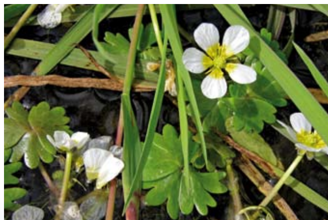
Vandranunkel kendetegner det rene vand.

De § 3-beskyttede vandløb er udpegede og fremgår alle af Miljøportalen www.arealinfo.dk . De fleste § 3-vandløb er naturlige vandløb, men de kan godt være regulerede. Langs de naturlige og højt målsatte vandløb skal der være en 2 meter-bræmme på begge sider af vandløbet. Bræmmen regnes fra vandløbets øverste kant.