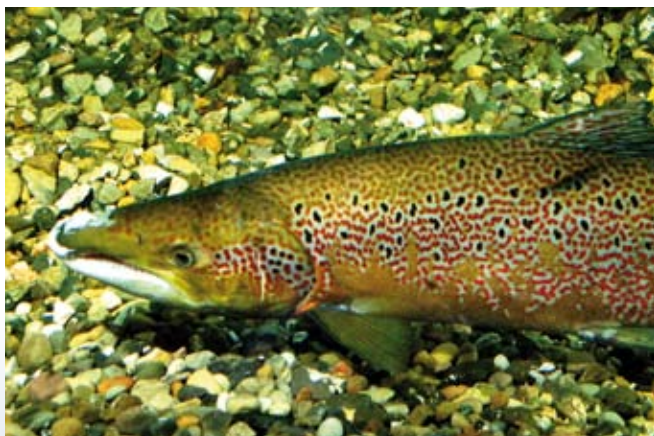
Varierede fysiske forhold i vandløbet, som forskellige dybder og vandhastighed, er med til at skabe gode levesteder for bl.a. Laks.