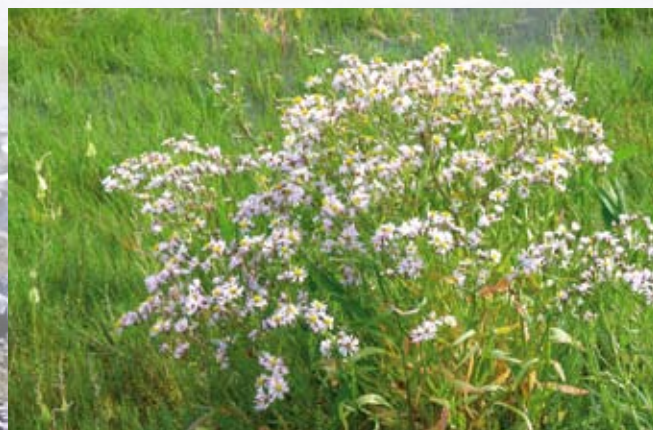
Strandasters er en karakterplante for strandengen.

Som resultat af et fælles græsningsprojekt fik lodsejerne sammenlagt flere fordele. De fik en flot natur i stedet for tilgroede arealer, kommunen sørgende for de praktiske ting omkring rydning og hegning af arealerne, og kvægholderen fik et større areal, der var lige til at sætte dyrene ud på.