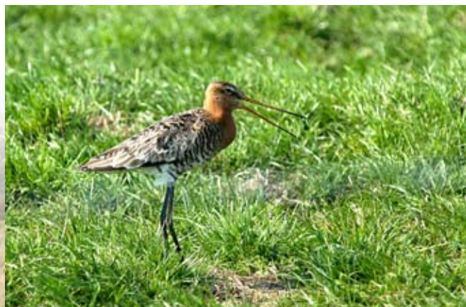
En karakteristisk fugl for engen er Stor kobbersneppe.