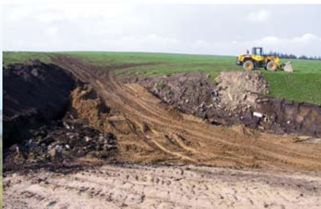
Det vil tage mange år og en stor indsats at genskabe dette ødelagte overdrev.

For landmanden gav det meget ekstra arbejde, der kunne være undgået, hvis han forinden havde kontaktet kommunen og hørt, om der kunne være problemer med at opbevare materialet på arealet. For naturen vil det tage mange år, før plantedækket er gendannet, og planterne igen kan vokse på arealet.