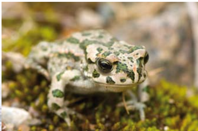
Grønbroget tudse kan yngle i vandhullerne på strandengene, da æg og haletudser tåler en vis koncentration af salt i vandet.