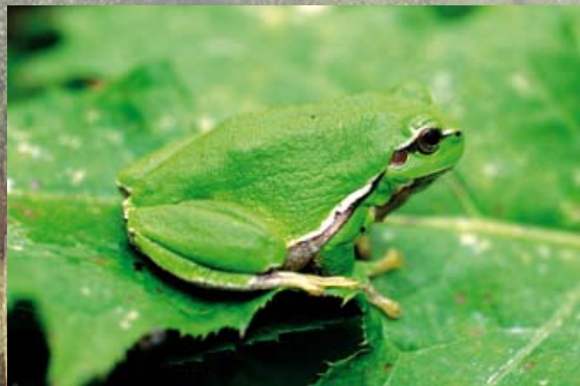
I moserne lever mange forskellige padder og insekter. Her er Løvfrøen.

Selvom moserne er en af de mest udbredte naturtyper i Danmark, er mange moser blevet afvandede og er nu opdyrkede. De tilbageværende moser ligger ofte som små isolerede øer af natur i landskabet og er dermed vigtige som fristeder for dyr og planter.