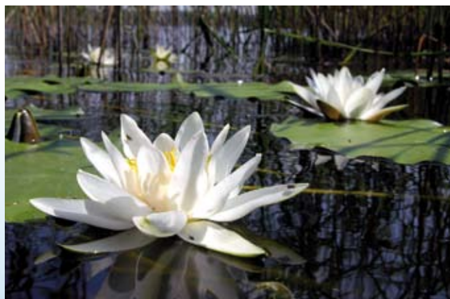
Hvid åkande er karakteristisk for rene søer.

Etablering af udyrkede randzoner omkring søer og vandhuller vil beskytte dem mod tilførsel af næringsstoffer og pesticider og forbedre levevilkårene for vilde planter og dyr.