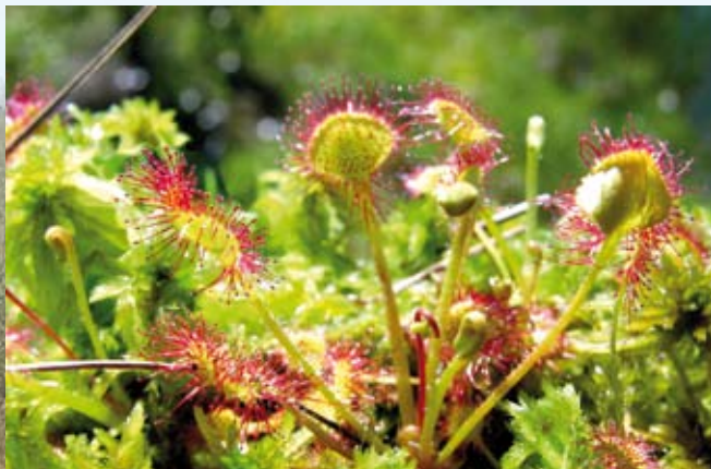
I næringsfattige moser vokser den kødædende plante Rundbladet soldug.