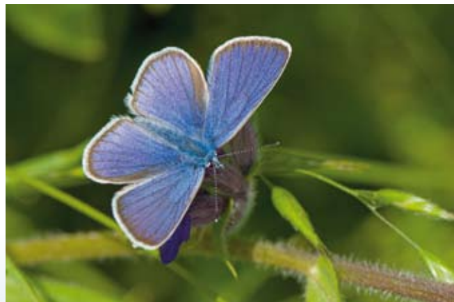
En af engens mange sommerfugle er Engblåfuglen.