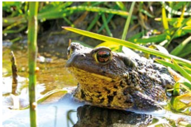
Skrubtudsen vender typisk tilbage til det samme vandhul år efter år.