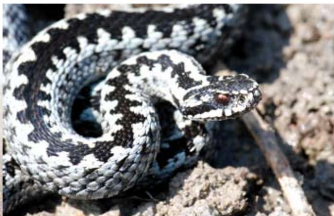
De tørre og varme forhold på heden tiltrækker krybdyrarter som Hugorm.

I modsætning til de artsrige overdrev og enge, er der kun få plantearter, der trives på hederne. Til gengæld er det arter, som vi ikke ser ret mange andre steder i Danmark. Så selvom hederne i dag kun udgør en lille del af det samlede danske areal, bidrager hederne til at give en større variation og rigdom af forskellige planter og dyr.