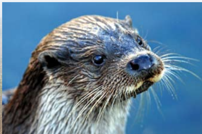
Odderen lever ved uforstyrrede vandløb med gode muligheder for at skjule sig i vegetationen.