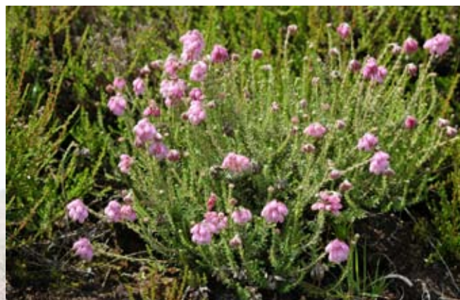
Klokkelyngen er en af de dominerende planter i de fugtige områder på heden.

Hedens planter tåler ikke meget næring. Ved øgede mængder næring f.eks. fra luften klarer græsser sig bedre end lyngen, så den flotte lynghede ændres til en mere ensformig græshede. Efterhånden kommer buske og træer til og heden skifter helt karakter.