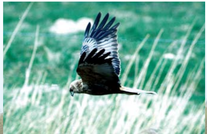
I mosens rørsumpe har Rørhøgen sin rede.