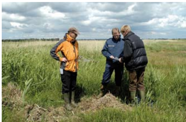
Landmanden tager en snak med sin rådgiver.

Læs mere om de forskellige tilskudsordninger her: Naturstyrelsens hjemmeside: www.naturstyrelsen.dk FødevarerErhvervs hjemmeside: www.ferv.fvm.dk Plantedirektoratets hjemmeside: www.pdir.fvm.dk Eller på LandbrugsInfo: www.landbrugsinfo.dk