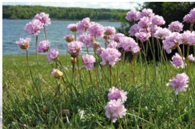
Plantevæksten på en græsset strandeng er inddelt i zoner, afhængigt af planternes evne til at tåle salt. Her ses Engelsk græs.