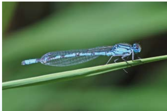
Rene vandhuller er gode levesteder for dyrelivet. Her ses Almindelig vandnymfe.