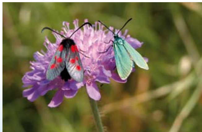
De mange planter er levesteder for mange forskellige insekter. Her ses Fempletten og Grøn køllesværmer, der sidder på en Blåhat.