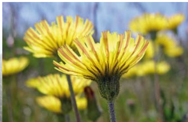
På overdrev findes et særligt planteliv med mange forskellige arter. Her ses Håret høgeurt.

Overdrev hører til de naturområder, der er forsvundet flest af som følge af opdyrkning eller tilplantning. I dag er de største trusler, at der kun er få og små arealer tilbage samt manglende pleje, tilgroning og gødning. Når der er få arealer med overdrev tilbage bliver de arter, som lever her sjældne og kan i sidste ende helt forsvinde fra en egn eller fra Danmark. Hvis græsning eller høslæt ophører, eller der kommer for mange næringsstoffer gror overdrevet til med store, hurtigt voksende planter. De overskygger de mange små plantearter, og resultatet bliver en mere ensformig plantevækst og dermed færre forskellige arter af både planter og dyr. Et vigtigt tiltag er derfor at bevare græsning og høslæt på overdrevene eller at genoptage disse driftsformer, samt at undgå gødsning.