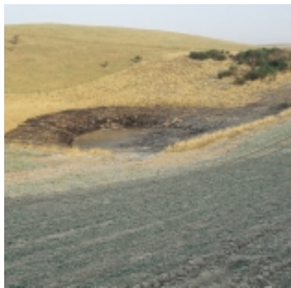
- og efter