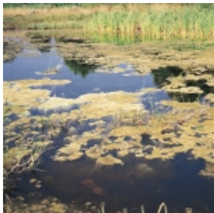
For mange næringsstoffer

Vær opmærksom på, at udsætning og fodring i vandhuller ofte kræver en særlig tilladelse.