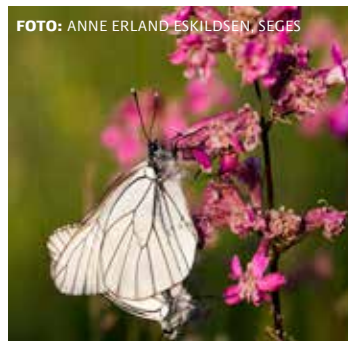
Tjærenellike og sortåret hvidvinge.