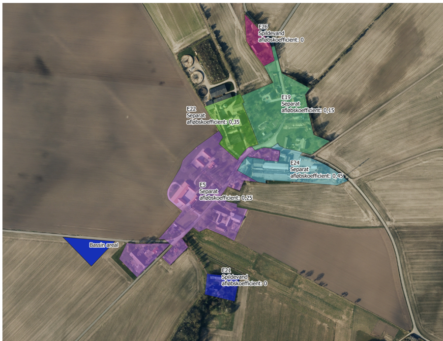
Figur 1. Kortoversigt af de dele af Fensten som separatkloakeres (E5, E19, E22 og E24) eller spildevandskloakeres (E21 og E26) samt placeringen af regnvandsbassinet (blåt område mod sydvest).